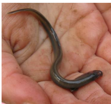
Bäcknejonöga från Rävlandaskolan.