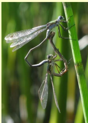
Smaragdfläcksländor vid Sätla