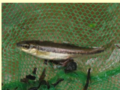
Äling från Sörån.

Tänk på att även andra inom organisationen kan vara intresserade av träffar och utbildningar!