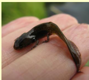
Mindre vattensalamander vid Strömme