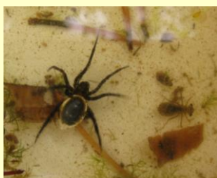
Vattenspindel och trollsländelarv vid Strömme.