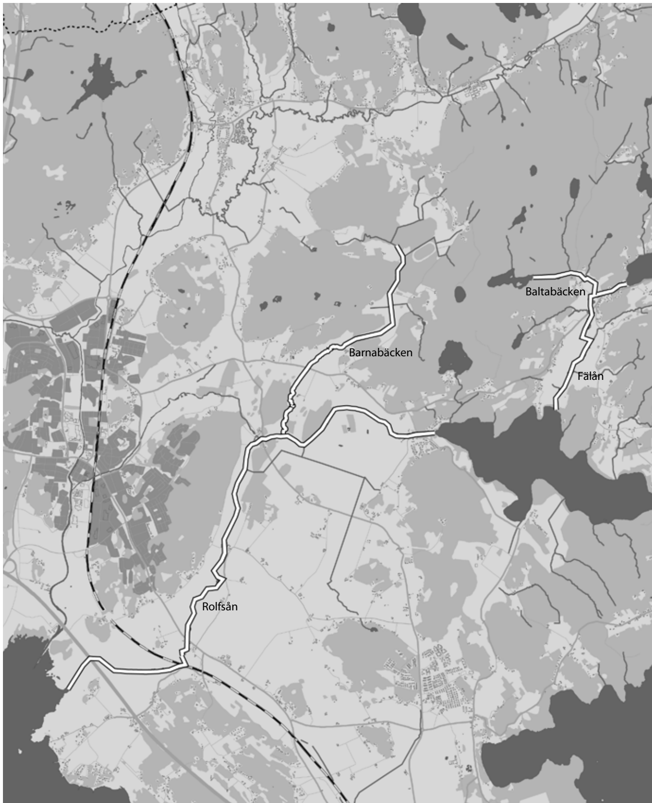
Skala 1:60000. Hanhals 9:1 m.fl.